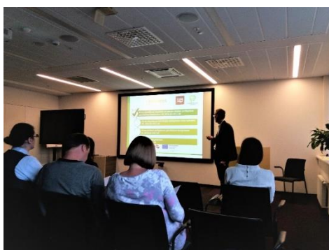
Foto no zinātnisko virzienu vadošo pētnieku tikšanās